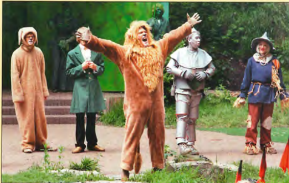
Der Zauberer von Oos, 2006

Wir sind im Jahr 2007 und freuen uns, mit Freunden der Freilichtbühne, allen heutigen und ehemaligen Zuschauern und mit allen ehemaligen Schauspielern dieses 50-jährige Jubiläum zu feiern. Herzlich willkommen!