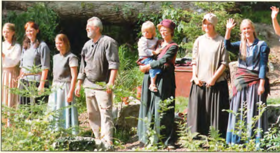
Die Räuberbande aus Robin Hood